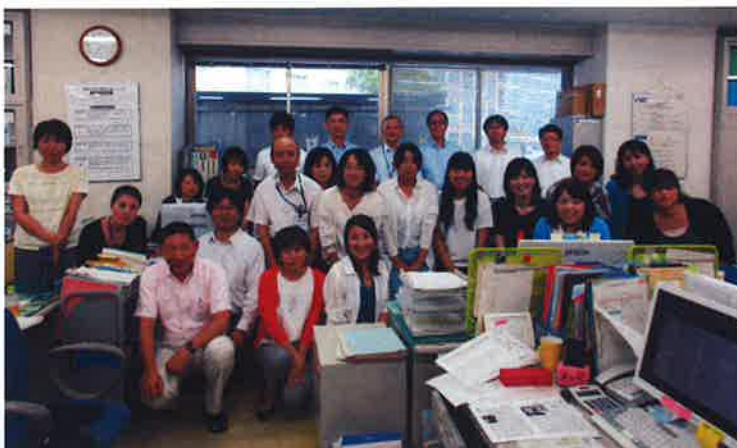
■ URAオフィスメンバー